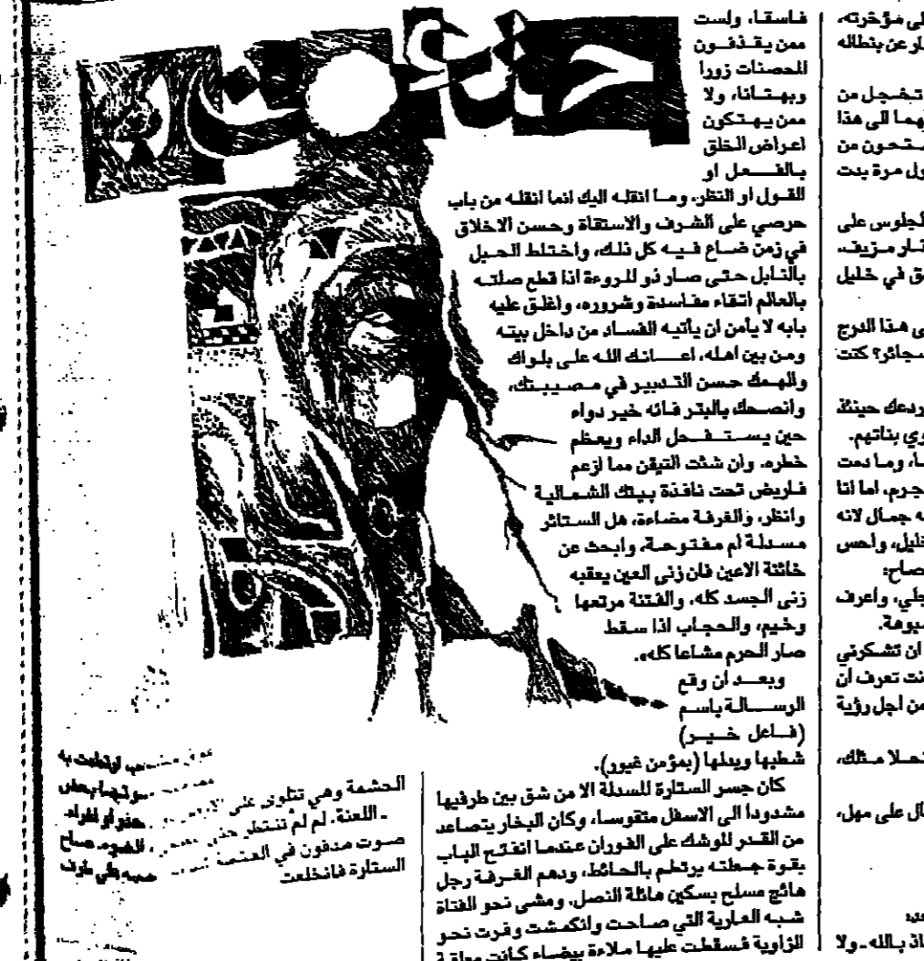
محمد الوراق (القص العربي)